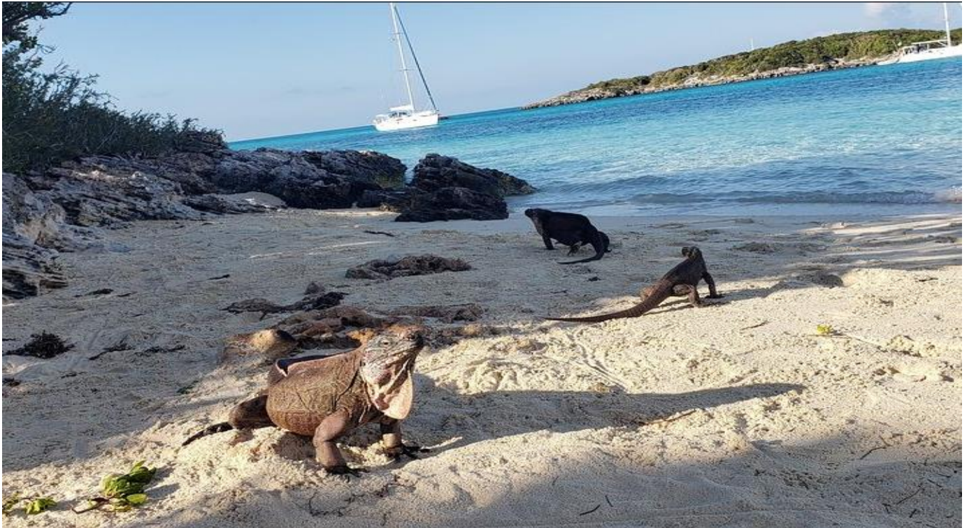
Alto-passeio de lancha rápida para Ship Channel Cay